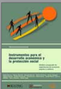
Instrumentos para el desarrollo económico y la protección social

Recomendamos a los presbíteros, diáconos, religiosas y religiosos, catequistas de parroquias y colegios, consejos pastorales, comunidades eclesiales y fieles, que lean la Carta Apostólica Porta Fidei de Benedicto XVI y la Nota con indicaciones pastorales para el Año de la Fe, preparada por la Congregación para la Doctrina de la fe. Allí se encontrarán sugerencias para vivir mejor este Año de Gracia.