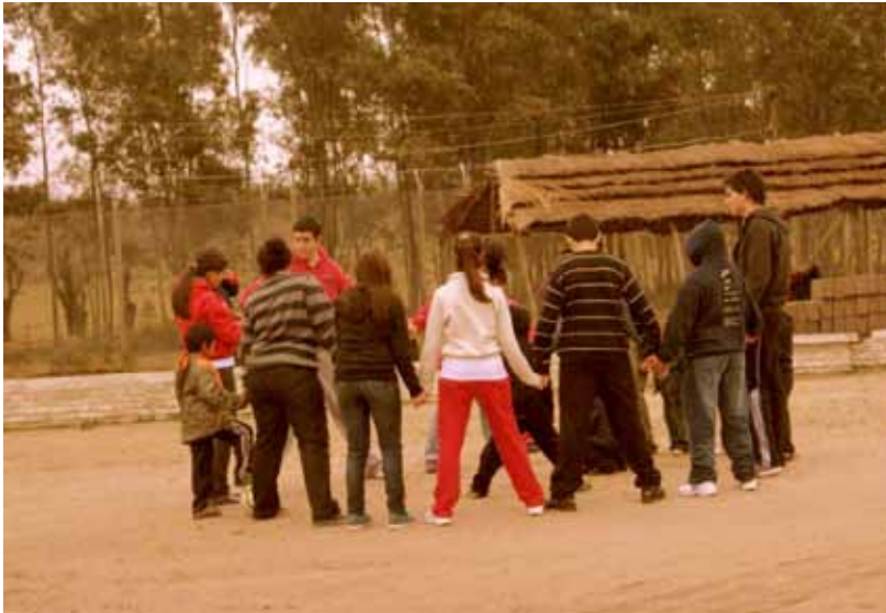
Día del niño en la cárcel de hombres.

organizaron la recreación y juegos para todos los niños de diferentes edades que ese día fueron al centro de reclusión a visitar a sus padres y estos le regalaron una hermosa fiesta. Estuvo muy bonito y movilizante, un nuevo desafío que adultos y jóvenes Kolping afrontaron juntos y con un éxito total.