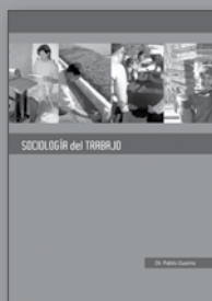
Sociología del Trabajo