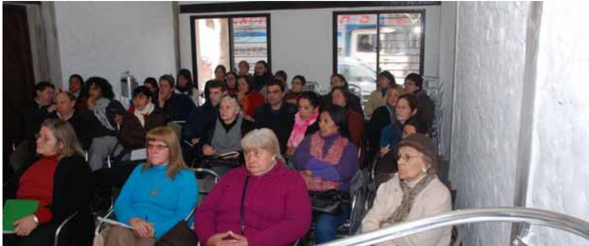
Jornada de capacitación sobre Desarrollo Humano y construcción de ciudadanía.