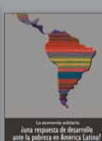
Una respuesta de desarrollo ante la pobreza en América Latina