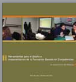
Herramientas para el diseño e implementación de la Formación basada en Competencias