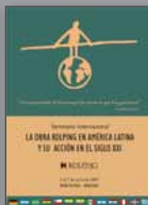
La Obra Kolping en América Latina y su acción en el siglo XXI