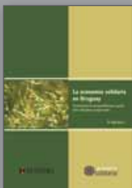
La Economía Solidaria en Uruguay