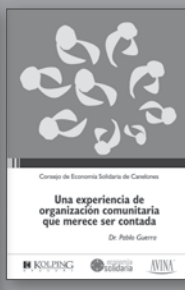
Una experiencia de organización comunitaria que merece ser contada