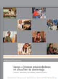
Apoyo a jóvenes emprendedores en situación de desventaja