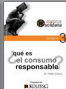
Cartillas: Economía Solidaria, Familia, Medios de comunicación