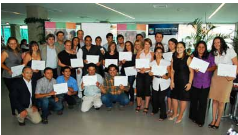
Entrega de Certificados a participantes del 2º taller en Rivera.

Contamos también con la participación y apoyo recibido desde la Intendencia Departamental de Rivera, a través del Área de Desarrollo y en especial de la Oficina de la Juventud. Igualmente agradecemos a ACIR (Asociación de Comerciantes e Industriales de Rivera), a los medios de comunicación, organizaciones y fuerzas vivas del departamento que nos acompañan.